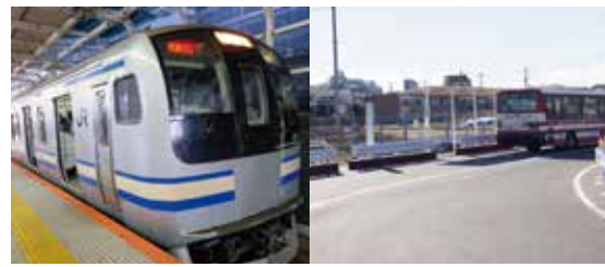
平成30年4月には暫定の駅広場が共用開始され、JR幕張駅バス乗り場もこちらに移設されました。

幕張北口駅前広場の整備は順調に進んでおり、令和5年度に駅前広場が完成すれば、バス路線の新規開設や増設、ルート変更など、利便性向上のためにも快速電車停車の必要性は更に増すものと考えております。総武快速電車の幕張駅停車の実現に向けたJR東日本への働きかけなどの状況について、お聞かせください。