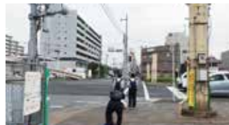
撤去された片側歩道橋

この交差点は、昨年4月に木更津側の歩道橋が、老朽化を理由に撤去されその後、時が止まったように具体的な動きが何もなく、1年余りが経過しています。地元の皆様から横断歩道を設置してほしいとの声も耳にしておりますので、幕張町5丁目交差点の横断施設の復旧に対する、今後の対応についてお聞かせください。