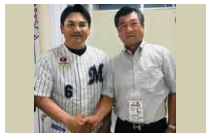
地元マリーンズを応援しています(激励会にて!)