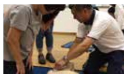
花園公民館にて赤十字インストラクターとしてAEDの普及活動中。

生まれも育ちも幕張町、花見川区に住んでいるからこそ見えてくる地域の課題があります。私は皆様の代表として、地域の声をしっかりと行政へ届けます。花見川周辺の整備や危険な道路・交差点への信号機設置など、遠い道のりでも決してあきらめず強い意志で挑みます。また「誰でも使えるAEDの普及活動」を推進しています。ぜひ、皆様のお力をお貸しください。