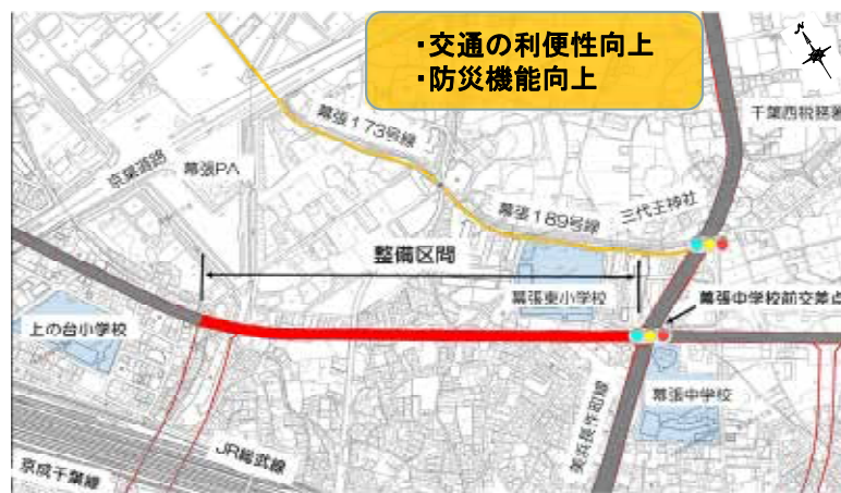
幕張町地区の状況(幕張町弁天町線)

そのため、交通が集中し、幅員も狭いため、緊急車両のすれ違いが困難な状況となっており、これまでも議会で取り上げてまいりました。地域住民の皆様も今後、どのように事業が進んでいくのか気にしているところです。改めて、現状と今後の予定について、お伺いします。