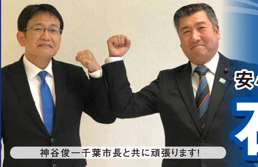
神谷俊一千葉市長と共に頑張ります!