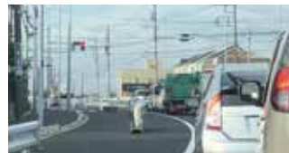
渋滞がひどい武石インター長作交差点

長作交差点から武石インターチェンジ方面に向かう約700mの未整備区間は、歩道のない2車線道路で、長作交差点には右折レーンがないため渋滞が発生し、地域住民も不便を強いられております。一日も早く渋滞が緩和されるよう整備を待ち望んでおりますので今後の予定について、お聞かせください。