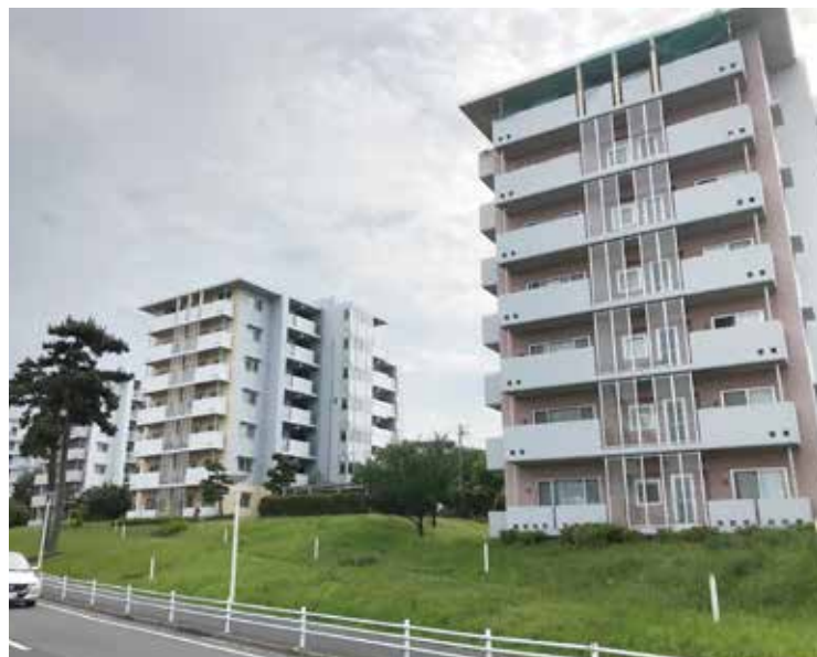
船橋市高根台団地

A 市内には開発面積5ヘクタール以上、42団地、人口は約36万人、全市人口の1/3の方が住んでおります。団地全体の高齢化率は29%で約4割の団地が高齢化率40%以上となっております。また、若い世代を居住誘導する為、市外から市内の団地へ転入する新婚世帯に対して、住居費や引越費用の一部を助成しております。さらに保育所等の子育て施設、学校、大規模公園、公民館等の公共施設の整備状況、民間企業と連携し住戸内のリノベーションにより若い世代を居住誘導する取組みを市のホームページにて情報発信を行っております。(都市局長答弁)