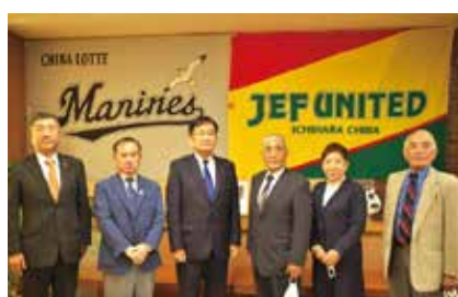
千葉市自衛隊協会の役員一同で、神谷千葉市長へ表敬訪問をしました。